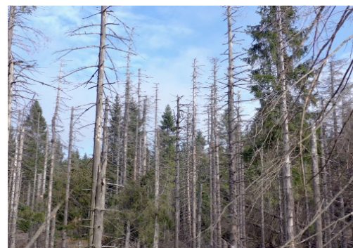
Příklad lesa napadeného kůrovcem