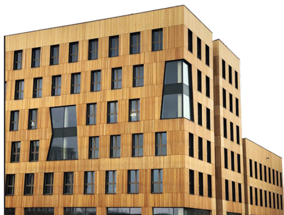
Výšková dřevěná budova ve Vídni HoHo Seestadt Aspern