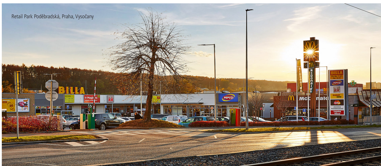
Retail Park Poděbradská, Praha, Vysočany